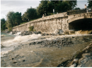
Arrivée des alluvions

L'eau est un élément vital de notre planète, sans elle, toute vie est impossible.