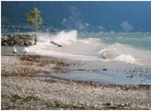
Transport naturel dû aux vagues