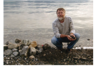
Sédentaires, nomades et va-et vient

Grèves et plages font partie du système lacustre, système écologique vital pour le lac ; elles entretiennent les lieux de frai des différentes espèces piscicoles qui peuplent le Léman. Suivant nos possibilités, nous nous devons de rétablir ces grèves aujourd'hui presque disparues : sur 200 km, il n'en reste que 6 km de naturelles soit 3%. Ces grèves font partie de notre patrimoine, du patrimoine lémanique que nous léguons à nos enfants.