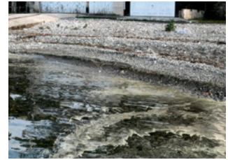
Les objets flottants s'échouent sur les grèves