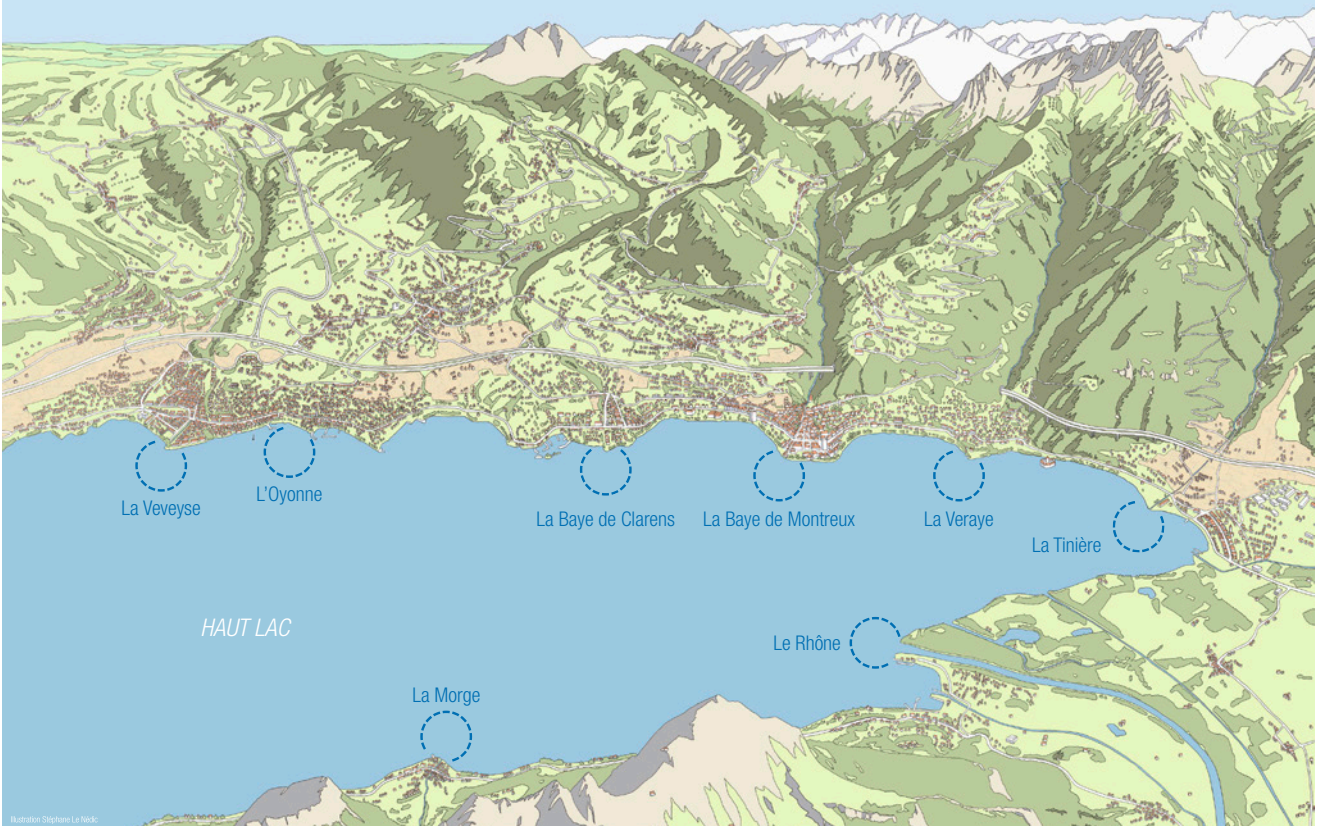
Illustration Stéphane Le Nédo

Principaux torrents de notre région apportant de nouveaux matériaux alluvionnaires depuis les montagnes jusqu'au lac.