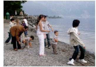
Les grèves servent de lieux de loisirs

Principaux torrents de notre région apportant de nouveaux matériaux alluvionnaires depuis les montagnes jusqu'au lac.